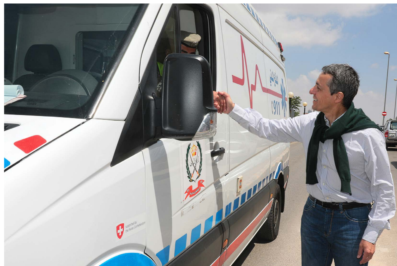
Bundesrat Ignazio Cassis besucht ein von der Schweiz finanziertes Kooperationsprojekt im Gesundheitsbereich. Amman, Jordanien, Mai 2018.

Die festgelegten sechs Aktionsfelder ermöglichen den kohärenten und effektiven Einsatz bestehender Ressourcen der involvierten Bundesstellen.