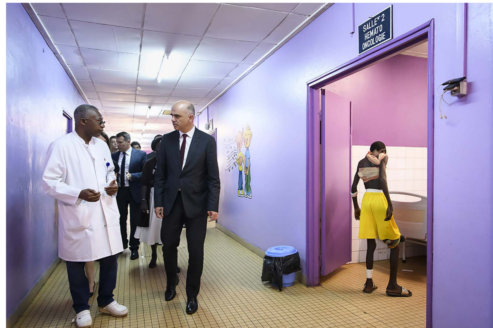
Bundesrat Alain Berset (rechts) und Doktor Jean-Chrysostome Gody (links), Direktor des Bangui-Kinderkrankenhauses, sprechen während eines offiziellen Besuchs in Bangui (Zentralafrikanische Republik), 7. Mai 2019