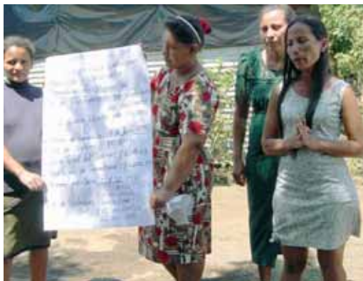
Comitato di utenti in Nicaragua: discussione delle tariffe

In Mozambico sono state assegnate a specialisti del settore idrico borse di studio per corsi di formazione di lunga durata. Questi sono risultati più efficaci rispetto a stage brevi. Oltre il 60%, delle 730 persone formate, ha poi potuto essere collocata.