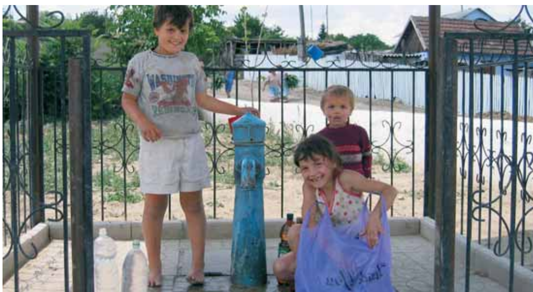
Bambini presso una fontana in Moldavia

Per quanto concerne la durabilità possono insorgere problemi specialmente nei paesi poveri, quando i canoni non coprono i costi reali e il sistema non è sufficientemente sorve-