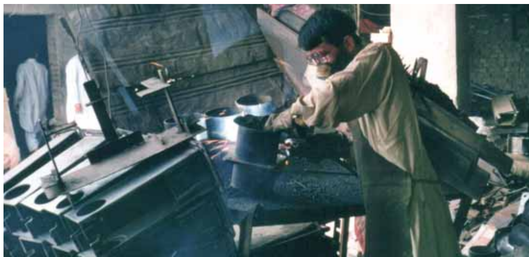
Artigiani locali producono pompe a mano, in India

Buona parte di questi effetti sono direttamente correlati al buongoverno (governance). Tanto a livello locale quanto a livello nazionale si è