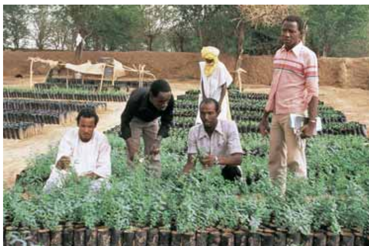
L'irrigazione permette una maggiore produzione: vivaio in Niger