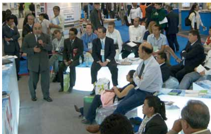
Stand svizzero al World Water Forum 2006 in Messico

il rafforzamento di istituzioni nonché l'attuazione di misure.