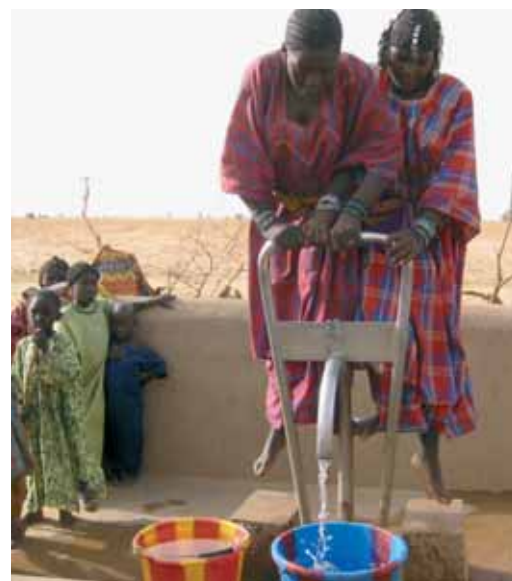
Benefici per donne e bambini

In fatto di aumento della produzione, il beneficio è relativamente facile da calcolare. Non sono invece contemplati nell'analisi altri tipi d'effetti (p.es. migliore risoluzione dei conflitti).