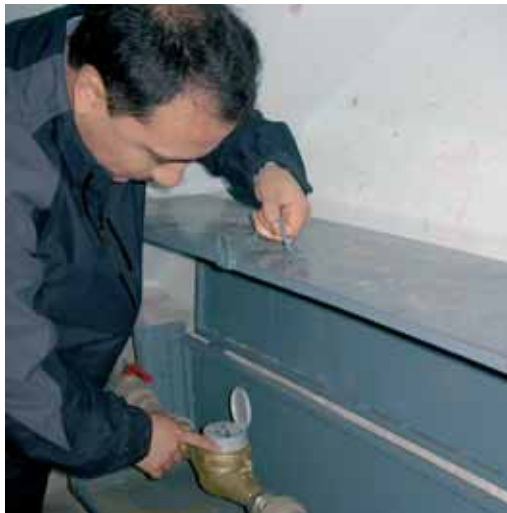
Khujand: i contatori dell'acqua sono di grande importanza per l'etica di pagamento degli utenti

Tutti i progetti esaminati mostrano effetti positivi a livello di condizioni quadro, specie in termini di impulsi economici, management dei conflitti, protezione dell'ambiente, potenziamento delle aziende di fornitura e di smaltimento nonché in materia di buongoverno.