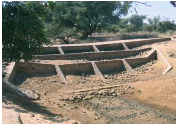
Soglia fluviale nella provincia di Tera in Niger