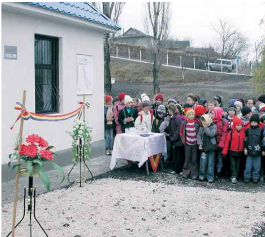
Inaugurazione di una stazione di pompaggio in Moldavia

Tutti i programmi svizzeri inglobano una componente formativa e sono quasi sempre coronati da successo: il sapere trasmesso viene recepito e messo in atto.