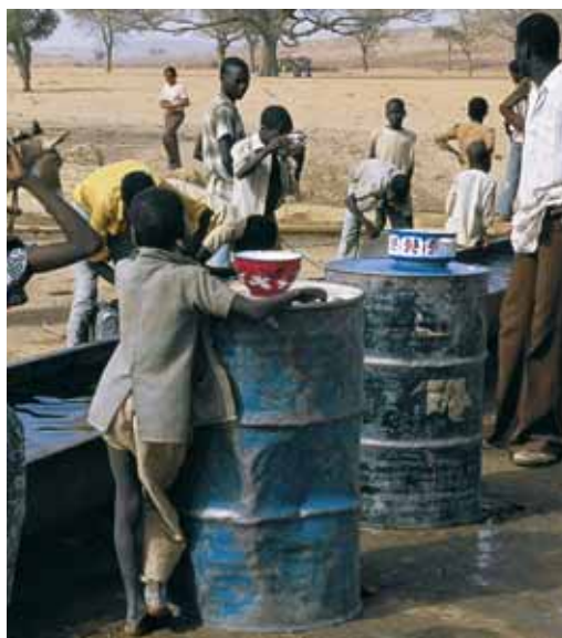
Pozzo d'acqua in Niger

Risultano pure compromessi gli effetti sulla salute perseguiti dal programma in Bangla-