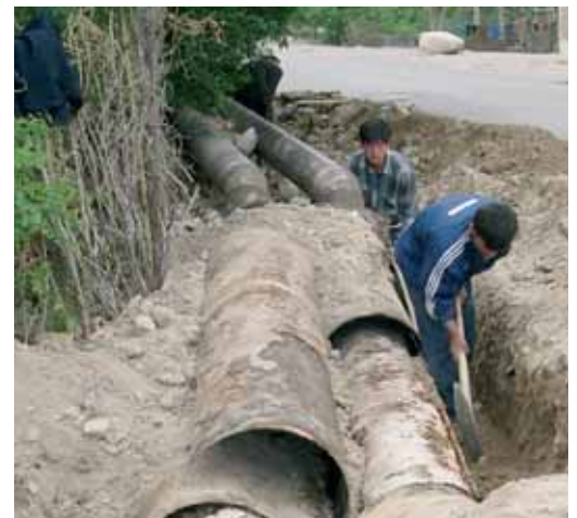
Ammodernamento della rete di distribuzione a Khujand

Nella Valle di Fergana (Asia centrale) la Svizzera ha sostenuto la modernizzazione dei sistemi di irrigazione e di coltivazione. A trarne profitto, direttamente e indirettamente, sono state 680'000 persone, su un territorio di 1700 km 2 .