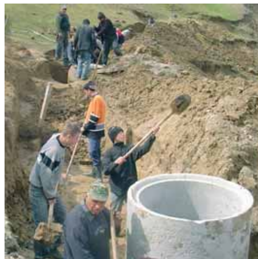
Coinvolgimento attivo della popolazione in Moldavia

Nel 2007, in collaborazione con esperti della società di consulenza FAKT, il Deutsches Institut für Entwicklungspolitik (DIE) ha analizzato l'efficacia di 10 programmi idrici condotti dalla Svizzera in 9 paesi: Bangladesh, Kirghi-