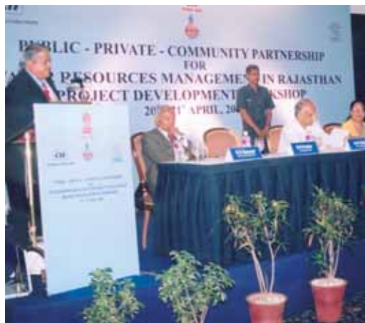
Fondazione di un partenariato pubblico-privato in India

Sostenendo la segreteria di questa commissione, la Svizzera ha contribuito a costituire un'istituzione regionale interstatale in una regione che fino a poco tempo fa era ancora teatro di frequenti conflitti. La regione attorno al delta del fiume Mekong sta ora vivendo una crescita economica vertiginosa, specie nel settore del commercio (navigazione fluviale) e dell'ingegneria idroelettrica.