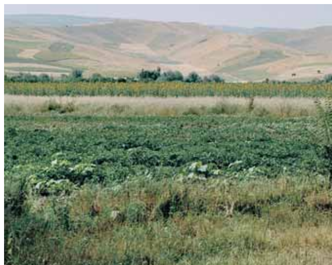
Campi coltivati nella Valle di Fergana