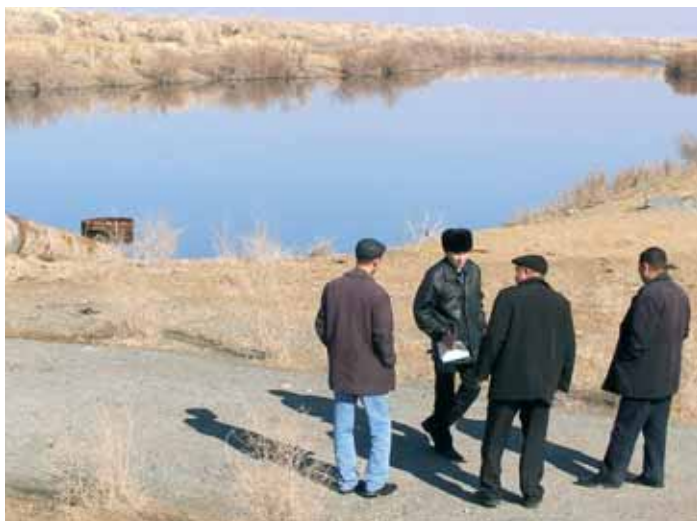
Bacino di depurazione a 30 km da Nukus