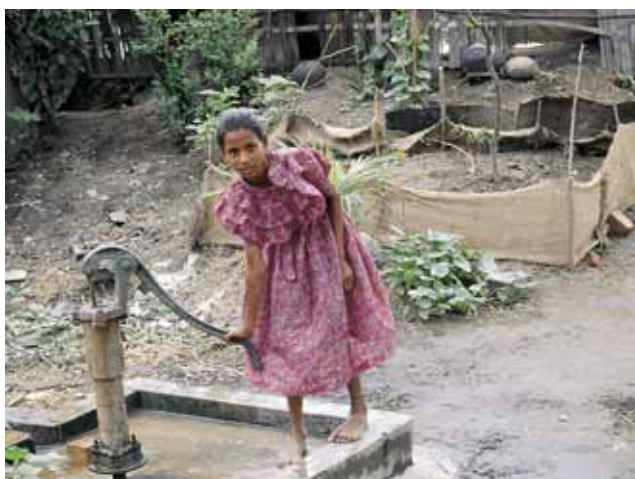
Pompa a mano in Bangladesh

Nella maggior parte dei programmi attivi nel settore dell'acqua potabile occorre inoltre rafforzare le componenti legate allo smaltimento (acque di scarico, latrine). E ciò è tanto più importante quanto più cresce la produzione di acque reflue dovuta al miglioramento dell'approvvigionamento di acqua potabile.