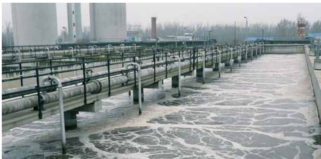
Impianto di depurazione a Deprecen in Ungheria

dati alla riduzione dei rischi di catastrofi naturali e dei conflitti legati all'acqua hanno inoltre giocato un ruolo significativo nella prevenzione delle crisi.