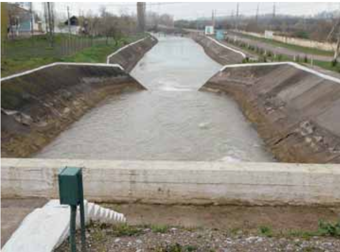
Canale d'irrigazione nella Valle di Fergana in Asia centrale

Un importante dato emerso dal rapporto d'efficacia è che i programmi sostenuti dalla Svizzera nel settore idrico dovrebbero apportare dei miglioramenti in merito al rilevamento di dati sull'accesso all'acqua e riguardo all'efficacia.