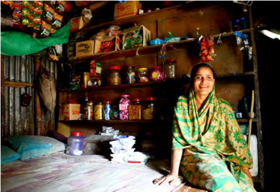
Lorsque le domicile fait également office d'épicerie au Bangladesh

Swiss Agency for Development and Cooperation SDC