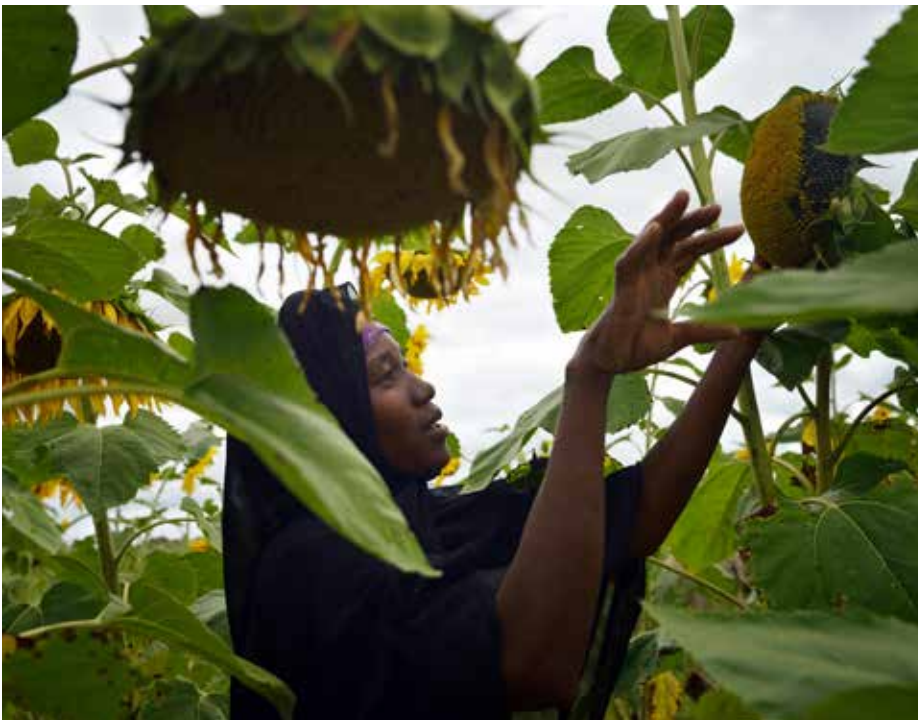
Une productrice tanzanienne évalue la future récolte de tournesols