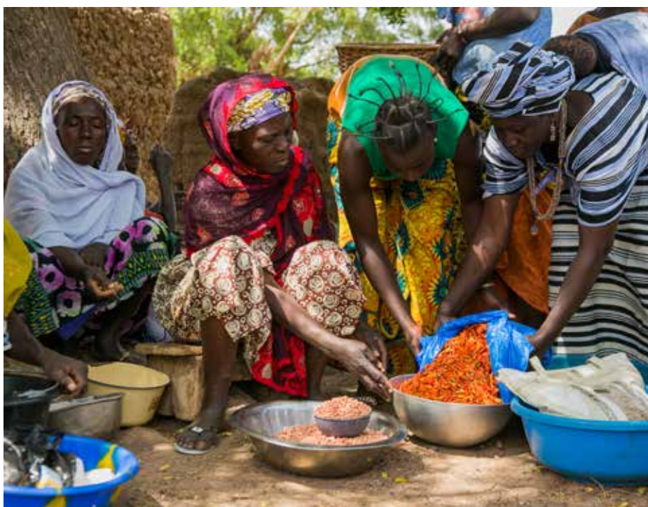
Marché agricole à l'ombre d'un arbre au Mali

conseil d'administration / comité de direction, les activités par lesquelles le partenaire démontre son aptitude à travailler efficacement et équitablement avec les femmes, les hommes et les personnes socialement défavorisées, sa capacité à collecter de manière avérée des données ventilées par sexe et l'existence de systèmes de suivi et d'évaluation.