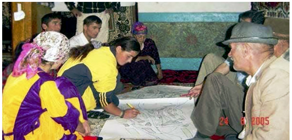
Cooperación Suiza, Evaluación participativa de la aldea, Tayikistán.

El análisis pregunta si existen políticas de igualdad de género, o cómo diferentes políticas influyen en la vida de mujeres y hombres.