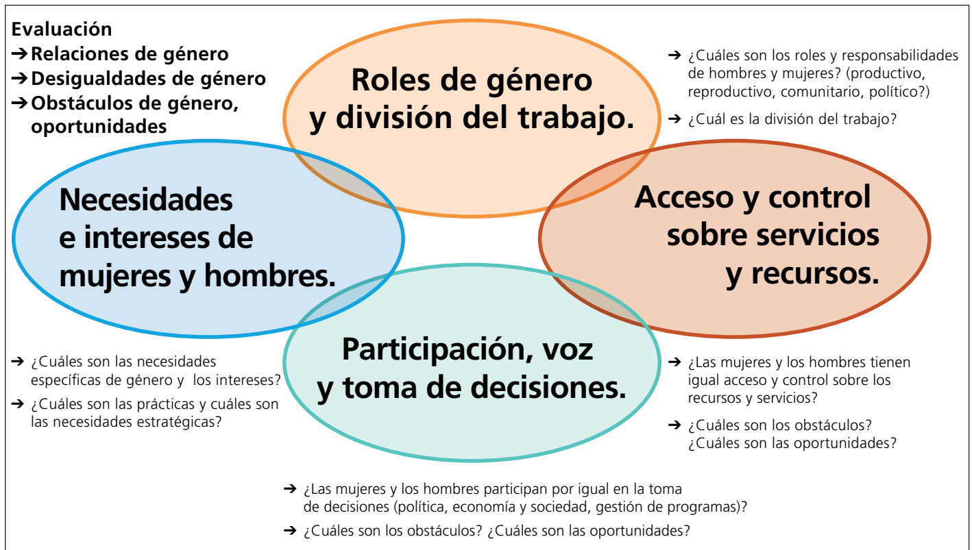
Figura 1: Los cuatro lentes de género.

quier contexto dado. El siguiente esquema y tabla proporcionan una descripción general de los cuatro lentes, los conceptos respectivos y las preguntas de investigación relacionadas.